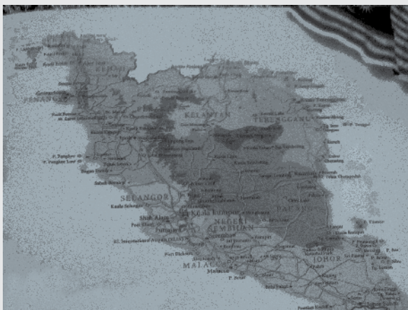
نقشه کشور مالزی

باتوجه به اینکه قصد دارم ماجرای این سفر را از زوایای مختلف بنویسم، قبلاً نقشه‌ها و اطلس‌های مربوط به این کشورها را مطالعه کرده‌ام و تقریباً می‌توانم موقعیت خودم را تشخیص دهم. این تجربه تازه که قبل از حضور در هر مکانی می‌توانم موقعیت خودم را بدانم، برایش جالب است. امکان درک چنین فضایی، بدون استفاده از دانش و