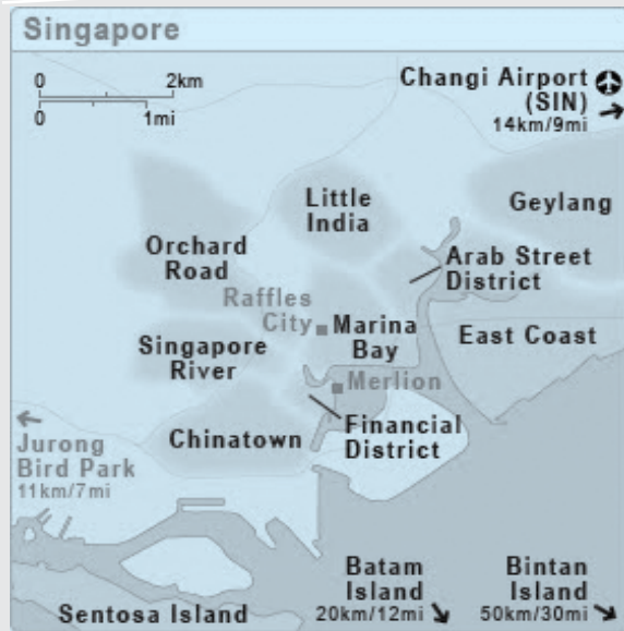
نقشه محدوده‌های داخلی سنگاپور

زمانی کشور پهناور ایران باستان، با استان سین کیانگ در چین همسایه بوده است. هنوز هم پس از گذشت قرن‌ها می‌توان اثر فرهنگ ایرانی را در زندگی مردم این سامان دید. هنوز هم پس از قرن‌ها اگر امام جماعت شیعیان در آن دیار زبان فارسی نداند و شاهنامه و بوستان و گلستان نخواند، بر او خرده می‌گیرند